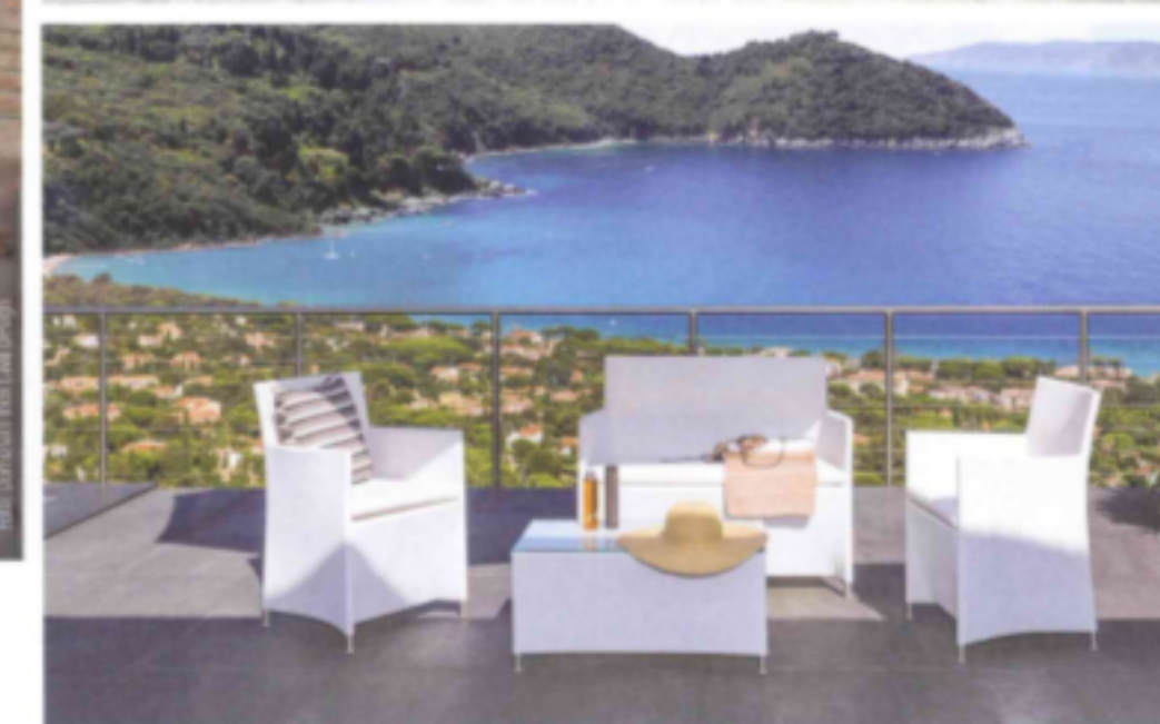
Bei der Kollektion Easy von Talenti wird der Aluminiumrahmen mit wetterfestem Textil überzogen.