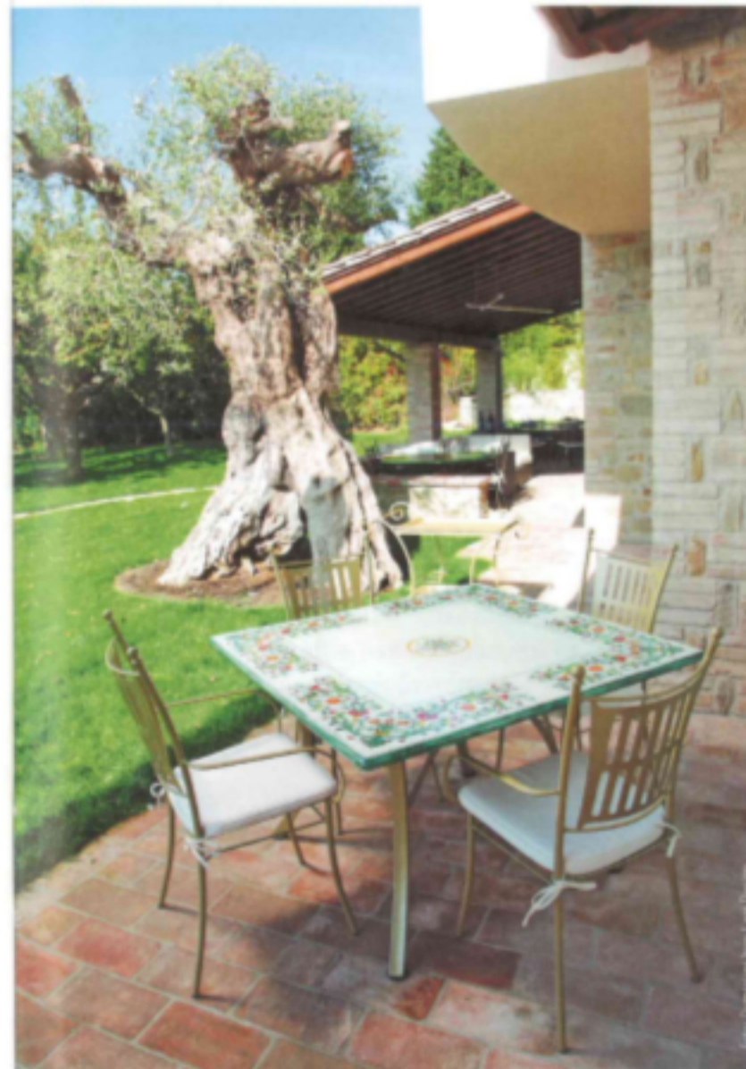
Lavastein ist die Grundlage der Tischserie Classico Sun von Domiziani Inox Lava Design.

Zur Planet Family aus der Kollektion Plus* von Euro3Plast SpA ( www.plus.it , Messestand nicht bekannt) gehört ein Stuhl mit klaren starken Linien. Seine Beine bestehen aus Holz (natur oder dunkel) und werden mit dem Körper aus PE während der Rotationsformung verbunden. Bei den verschiedenen