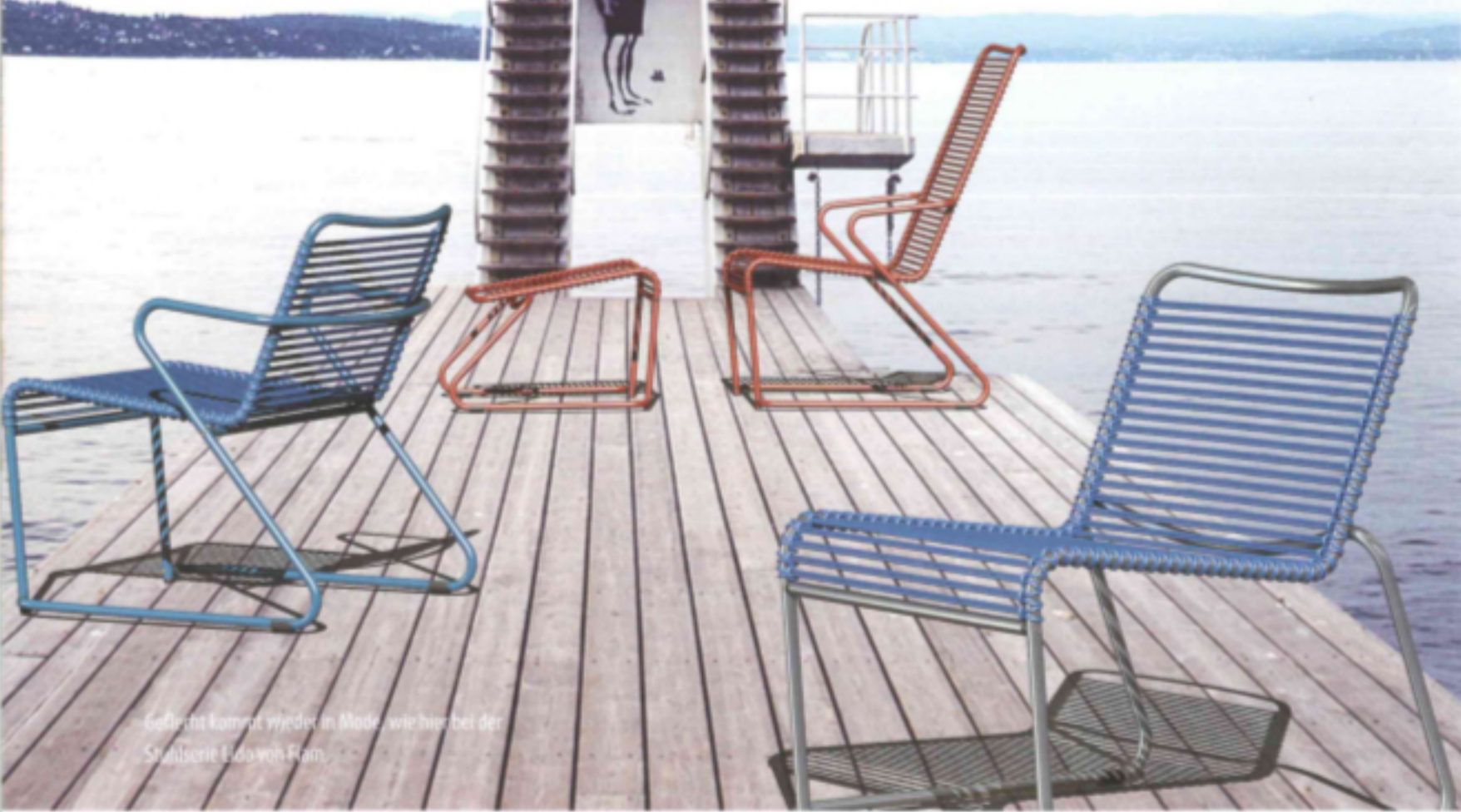
Gefestigt kommt wieder in Mode, wie hier bei der Stahlserie Edo von Ram.